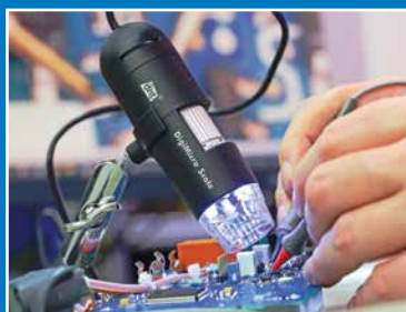
Onderhoud, reparatie en kalibratie