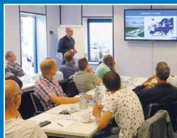
Cursussen en workshops